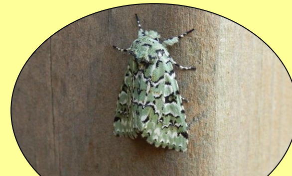
ケンモンミドリキリガ 晩秋に見られる薄緑色のガです。(11月上旬~下旬頃)