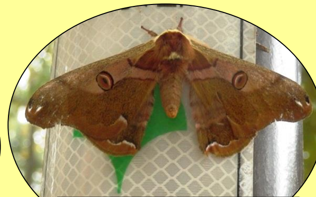
ヒメヤマユガ 雑木林で見られる大きなガ。(10月~11月初め)