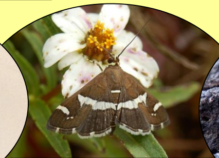
シロオビノメイガ 昼間活動し、花の蜜を吸う小型のガです。(9~10月頃)