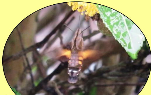
ホシホウジャク はねを素早く動かして、昼間花の蜜を吸います。 (8~10月頃)