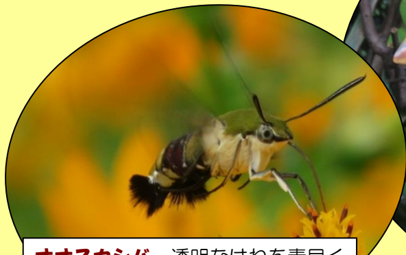
オオスカシバ 透明なはねを素早く動かして、昼間花の蜜を吸います。 (7~10月頃)