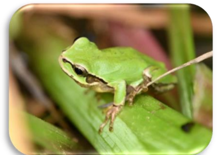
ニホンアマガエル