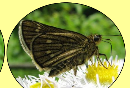
コチャバネセセリ はねは脈に沿って細いすじもようがあります。(4月末～9月頃)