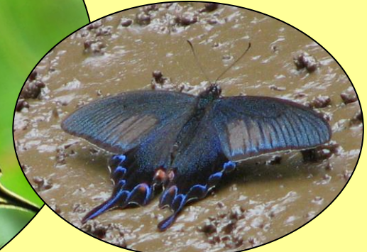
カラスアゲハ 黒い中に青や緑色があります。(5月頃と真夏の年2回)