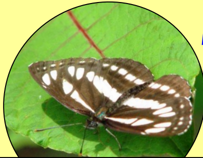
コムスジ 3列の白いすじがあり、やや小型です。(4月末～10月初め)