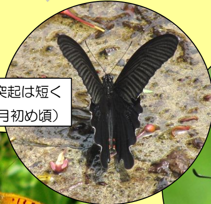
クロアゲハ 後ろばねの突起は短く太いです。(4月後半～10月初め頃)