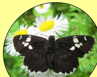
ダイミョウセセリ はねをひらいてよくとまります。(5月～10月中頃)