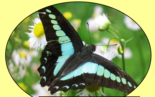
アオスジアゲハ 青いすじが目立ちます。 (5月～10月中頃)