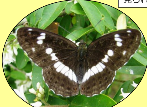
イチモンジチョウ 白いすじは逆八の字型です。 (5月下旬～10月頃)