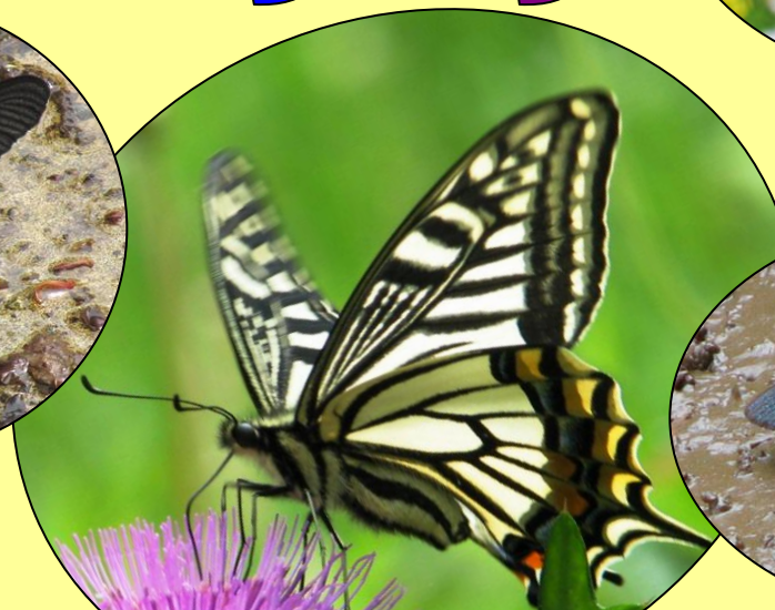
ナミアゲハ 前ばねのつけねはたてすじもようです。(4月～10月初め頃)