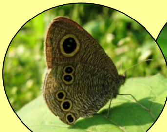
ヒメウラナミジャノメ 目玉もようと細かい波もようがあります。(4月末～10月頃)