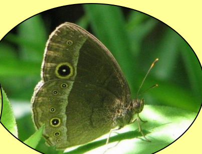
コジャノメ ジャノメチョウ類特有の目玉もようがあります。 (4月末～9月頃)