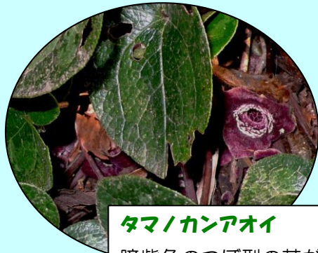
タマノカンアオイ