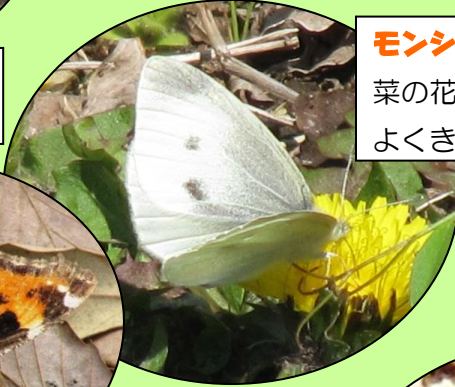
モンシロチョウ 菜の花やタンポポに よくきます。