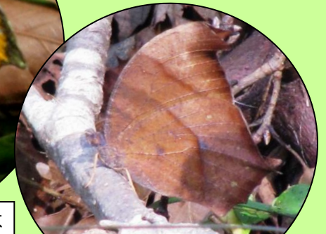
クロコノマチョウ 成虫で 冬を越します。木の葉に そっくりなチョウです。