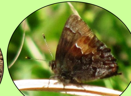
コツバメ はねの内側は青いですが、 いつも閉じてとまります。