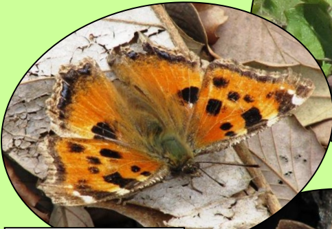
ヒオドシチョウ 6月から翌春まで 長く生きます。