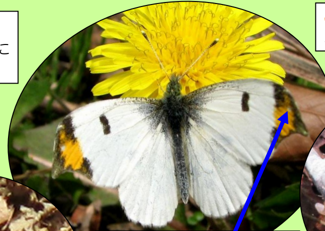
ツマキチョウ ここ がオスは オレンジ色、メスは白です。