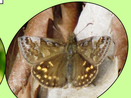
ミヤマセセリ 年1回 早春にだけ見られます。