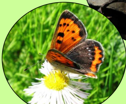
ベニシジミ 小さくてオレンジ色です。