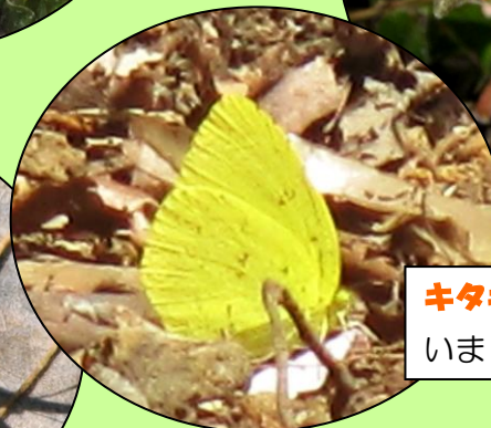
キタキチョウ 前はキチョウと呼ばれて いました。成虫で冬を越します。