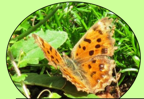
キタテハ はねはオレンジ色で へりがぎざぎざです。