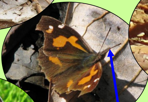
テングチョウ ここ が てんぐの鼻のように つき出ています