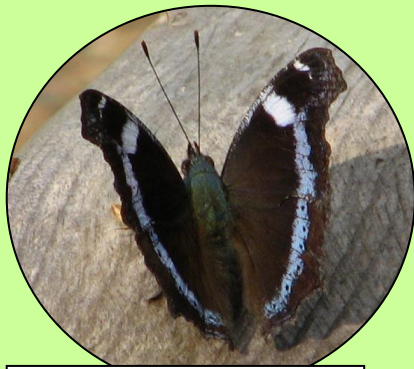
ルリタテハ 青い たてすじが目立ちます。