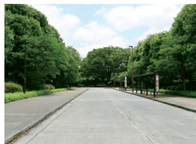
神代植物公園 正門手前プロムナード [無料区域]