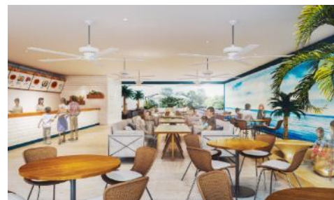
CRYSTAL CAFE 内観イメージ