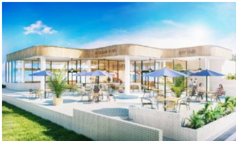
PARKLIFE CAFE & RESTAURANT 外観イメージ

また、各店とも親子連れが安心して過ごせる店舗として、キッズメニューの展開や無料休憩所へのキッズスペースを設置いたします。