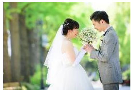
ウェディングイメージ