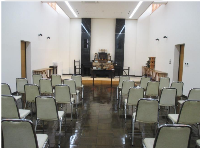
式場（椅子席から祭壇）