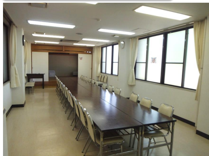
控室（奥に6畳の和室）