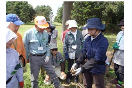
葛西臨海公園実習状況

講習内容：「日本水仙の特徴」、球根の掘り起しと分球の実習、年間作業スケジュールの作成