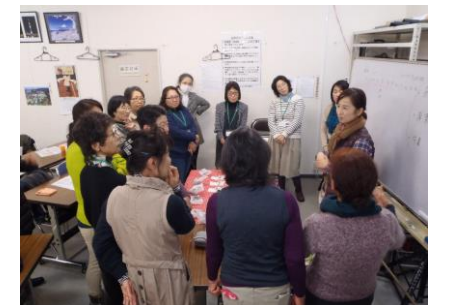
汐入公園実習状況

講習内容：「ハーブのガーデニング基礎講座」、土壌 pH 測定実習、ハーブ花壇への植栽アドバイス