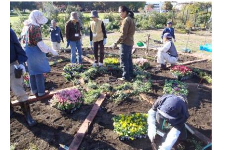
舎人公園実習状況

講習内容：公園入口のボランティア花壇のリニューアルに向けて、デザイン実習、一般参加者を交えての植え付け実習など