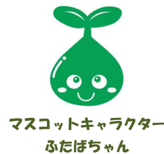
マスコットキャラクター ふたぼちゃん

緑化の助成事業のほかに、まちなかの公共の緑（街路樹など）と民有地の緑をつなぎ、広げ、増やすために、地域コミュニティを活性化し、相互作用を促す人材の育成なども行っています。