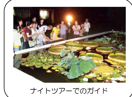
ナイトツアーでのガイド

熱帯植物の不思議や生活とのつながり等を伝えながら、夢の島熱帯植物館に足を運んで下さるお客様に楽しんで頂けるよう、これからもボランティア活動を続けていきたいと思っています。