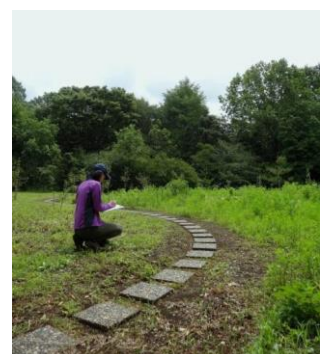
植生調査イメージ

各都立公園でも、様々なイベントや講座が行われております。皆様お誘いあわせのうえ、お出かけください。