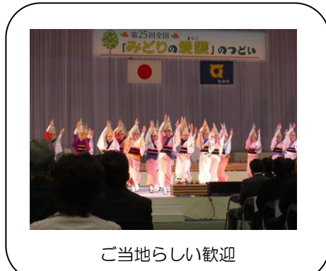
ご当地らしい歓迎