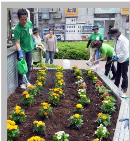
調布市つつじが丘花の街の花壇づくり