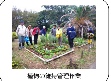
植物の維持管理作業