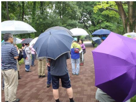
2班にわかれてガイドツアーへ！

第2部 ガイド体験：大人向けガイド、子供向けガイド等、4つのガイドを実際に体験しました。ガイドの一部は多様性植物センターボランティアスタッフの方が担当しました。