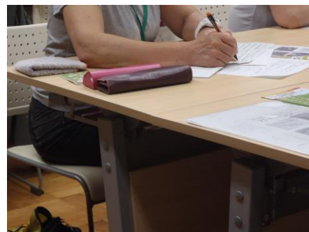
熱心にメモを取る受講者の方。

第2部 ガイド体験：大人向けガイド、子供向けガイド等、4つのガイドを実際に体験しました。ガイドの一部は多様性植物センターボランティアスタッフの方が担当しました。