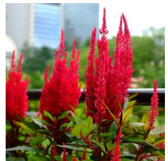
日比谷公園の実証実験花壇の様子です。