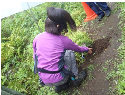
土を掘り、ジャノヒゲの根の特徴を観察。観察後は埋めて水をかけます。