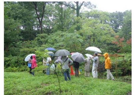
雨天での実施となりましたが、受講者の皆さんは積極的な姿勢で参加されていました。