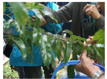
白熱するどんぐり探し。