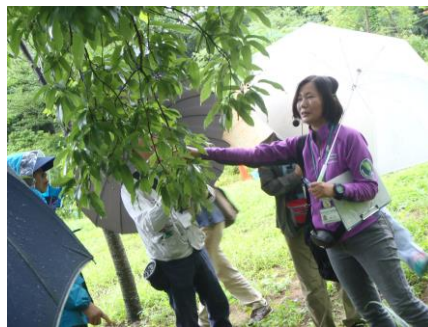
どんぐりはどこでしょうか？