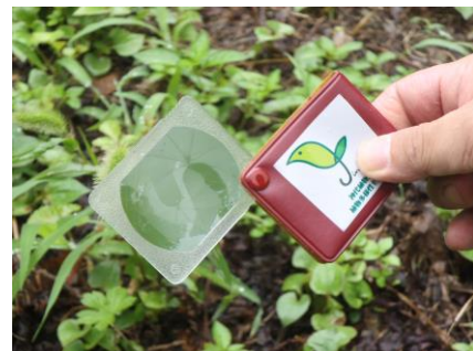
ルーペを使用してのエノコログサ観察。