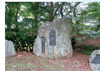
陸軍戸山学校跡記念碑

42年(1967)、戸山学校縁故有志により箱根山麓の周遊園路わきに石碑が建てられました。