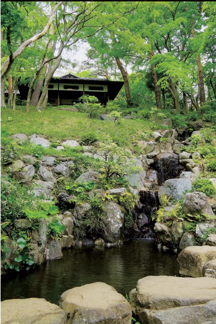
Organe gestionnaire: Association Municipale des Parcs et Jardins de Tokyo (Fondation d'Utilité Publique avec la Personnalité Juridique)

Jardin de plantes sauvages et d'eaux de sources de Musashino