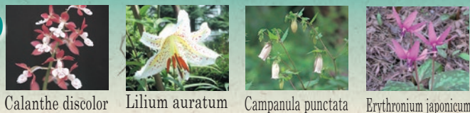
Calanthe discolor Lilium auratum Campanula punctata Erythronium japonicum

Suite au mouvement de la population pour la préservation du jardin s'opposant ainsi au projet de développement urbain dans les années 1960, le jardin fut acquis par la ville de Tokyo en 1974. Après travaux de restauration, le jardin est ouvert au public et le 21 septembre 2011, il est classé au site national d'exception sous la dénomination de « Jardin de Tonogayato teien (ou Zuigi-en) »