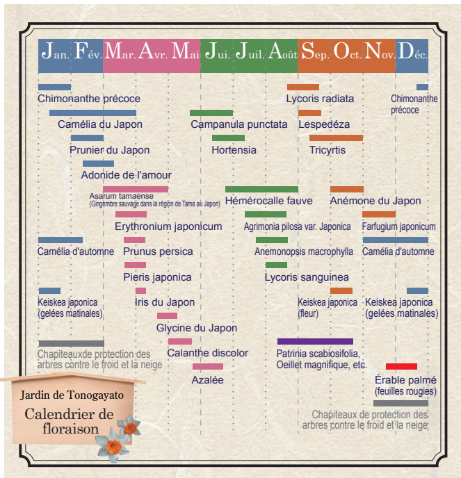
* Les périodes de floraison peuvent varier selon les conditions climatiques.