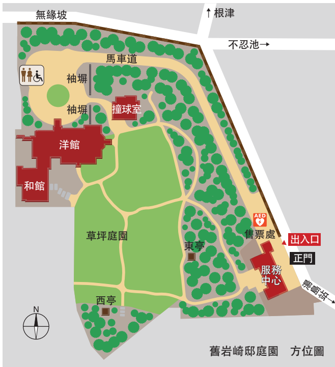
舊岩崎邸庭園 方位圖

【交通指南】 《電車》○東京地鐵千代田線「湯島」下車 1 號出口徒步 3 分鐘 ○東京地鐵銀座線「上野廣小路」站下車徒步 10 分鐘 ○都營大江戶線「上野御徒町」下車徒步 10 分鐘 ○JR 山手線・京濱東北線「御徒町」下車徒步 15 分鐘 ※未設置停車場