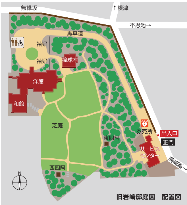
旧岩崎邸庭園 配置図