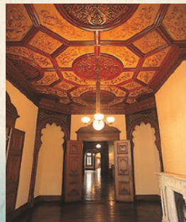
1階婦人客室天井はシルクの日本刺繍の布張りになっている。