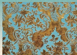
2階客室の金唐革紙。