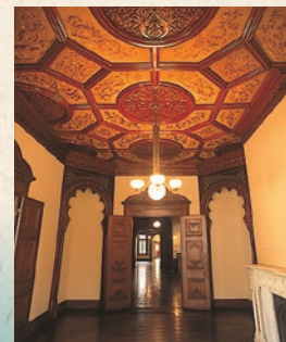
Une bordure de soie persane recouvre le plafond d'une des chambres du Rez-de-chaussée à l'est.