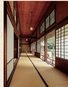
Les bois utilisés pour le pavillon japonais sont aujourd'hui quasiment introuvables.