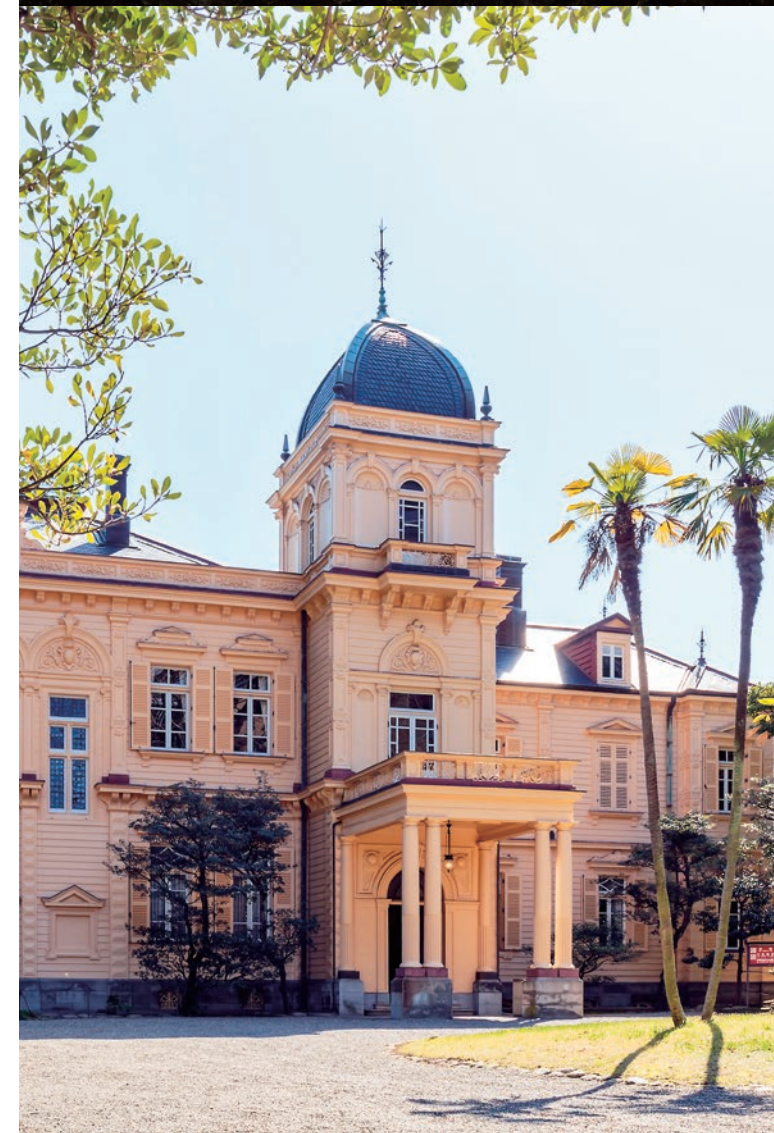
Organe gestionnaire: Association Municipale des Parcs et Jardins de Tokyo (Fondation d'Utilité Publique avec la Personnalité Juridique)

Un jardin traversé par le vent de l'histoire