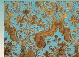
Papier en cuir doré utilisé dans une chambre d'invité