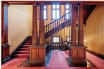
On retrouve des traces de l'architecture jacobéenne à l'intérieur du bâtiment.

Ce bâtiment était utilisé pour le rassemblement de toute la famille Iwasaki ayant eu lieu une fois par an, ainsi que pour des réceptions accueillant des invités prestigieux de toutes nationalités.