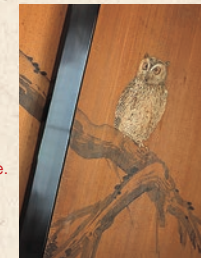
Peinture sur le bois de l'époque.

Adaptée de l'architecture classique Shoin-zukuri, ce bâtiment est relié à la résidence occidentale. Initialement, la construction s'étendait sur une surface de 1.815m2, superficie alors bien supérieure à celle du bâtiment occidental. Aujourd'hui, il ne reste que ce pavillon abritant le grand salon autrefois affecté aux grands événements cérémoniaux ou festifs. A l'intérieur, il reste encore des peintures sur « fusuma » (porte à glissière) ou des peintures murales basées, d'après ce qu'on dit, sur les dessins de Hashimoto Gasho, peintre de renom de l'époque Meiji. L'espace résidentiel de la famille Iwasaki, aujourd'hui disparu, était séparé en deux parties distinctes. Le côté sud du pavillon abritait les chambres du maître et des enfants, alors que le côté nord réunissait le quartier du personnel, la cuisine, des bureaux et entrepôt.