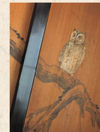
Aún se mantienen las placas de madera con dibujos.

En la actualidad, solo una edificación del gran salón, la cual sirvió para propósitos ceremoniales como el edificio occidental, ha sobrevivido. Ahí permanecen pinturas japonesas en alcoba y en las diapositivas de papel, de los cuales bocetos se cree han sido hechos por Hashimoto Gaho. Ahora no más espacio residencial existente para la familia Iwasaki ha sido dividido en secciones Sur y Norte. La sección sur fue usada para la habitación del maestro, la habitación de los niños y otros, mientras que la sección norte fue dedicada para los cuarteles del personal de servicio, cocina y espacio de almacenamiento.