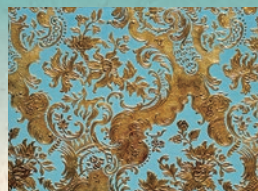
Los cuartos para huéspedes del 2do piso, están empapelados con el llamado "papel de cuero japonés".