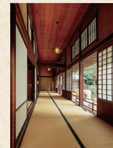
Para los componentes, se utiliza madera que es difícil conseguir en la actualidad.