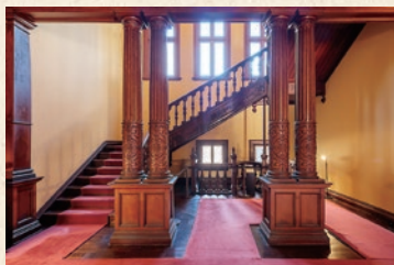
En los detalles de la residencia, se pueden apreciar diseños de estilo Jacobeo.

Antiguamente este lugar era usado como una casa de huéspedes privada, para la reunión anual de la familia Iwasaki completa; así como también para fiestas en las que se invita a huéspedes extranjeros y personas distinguidas. En los detalles de la residencia, se pueden apreciar diseños de estilo Jacobeo.