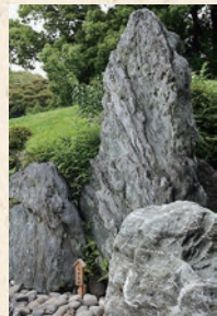
Chute d'eau sèches en pierre

Ce vaste étang, d'où se dessinent le reflet des oiseaux, des arbres et l'architecture du pavillon de thé Ryo-tei, est le centre d'intérêt du jardin avec ces trois îles émergées. Autrefois, la rivière Sumida alimentait l'étang du jardin dont le niveau, semble-t-il fluctuait légèrement suivant la marée dans la baie de Tokyo. Aujourd'hui, l'étang est alimenté par l'eau de pluie.