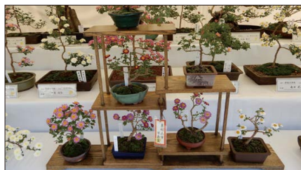
江戸の園芸文化に親しむ「菊花展」