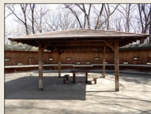
野鳥観察スペース

東京都公園協会事業全般に関するお問合せ 東京都公園協会本社 TEL. 03-3232-3011 公園検索 「公園へ行く」 https://www.tokyo-park.or.jp/ 2021年11月 公益財団法人 東京都公園協会