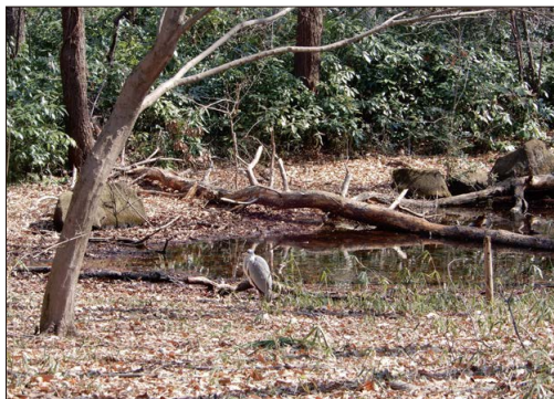
バードサンクチュアリ 野鳥の保護と生物の生息環境の保全のため、柵で囲い、中に池をつくっています。観察スペースから池に来る野鳥の観察ができます。

<園内花ごよみ> 春 ソメイヨシノ、コヒガンザクラ、ポピー 夏 ラベンダー、アジサイ、ヒマワリ 秋 ヒガンバナ、ジュウガツザクラ、小菊、ケヤキ・コナラの紅葉 冬 ロウバイ、サンシュユ