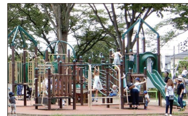
遊具広場 大小のコンビネーション遊具をはじめ、ブランコやシーソー、砂場など 13 の遊具があり、幼児や小学生に人気です。