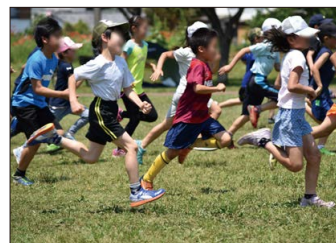
思い切り体を動かす「かけっこ教室」