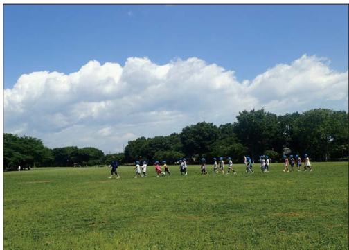
中央広場 公園中央に広がる大きな原っぱ。バッタなどの昆虫、ムクドリなど野鳥の姿も見られます。

年間の主な催物 春の緑の祭典 (4月29日) かけっこ教室 (春、秋)、森の工作教室 (秋)、菊花展 (11月)、しめ縄作り (12月)、クリスマスイルミネーション (12月)、防災フェスタ