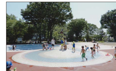
マイマイ池 かたつむりのように渦巻状に水が流れます。ゴールデンウィークと夏休みに水遊びができます。