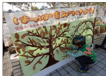
身近な自然と遊ぶ「葉っぱを見つけよう！」