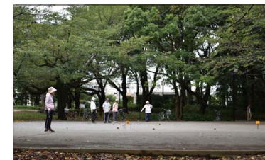
ゲートボール場 東と西に 2 面あり、年配者のゲートボールやグランドゴルフの利用が盛んです。