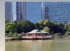
시오이리노 이케와 나카지마노 오차야(옛모)