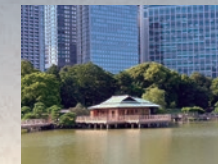
Shioiri-no-ike et Nakajima-no-ochaya