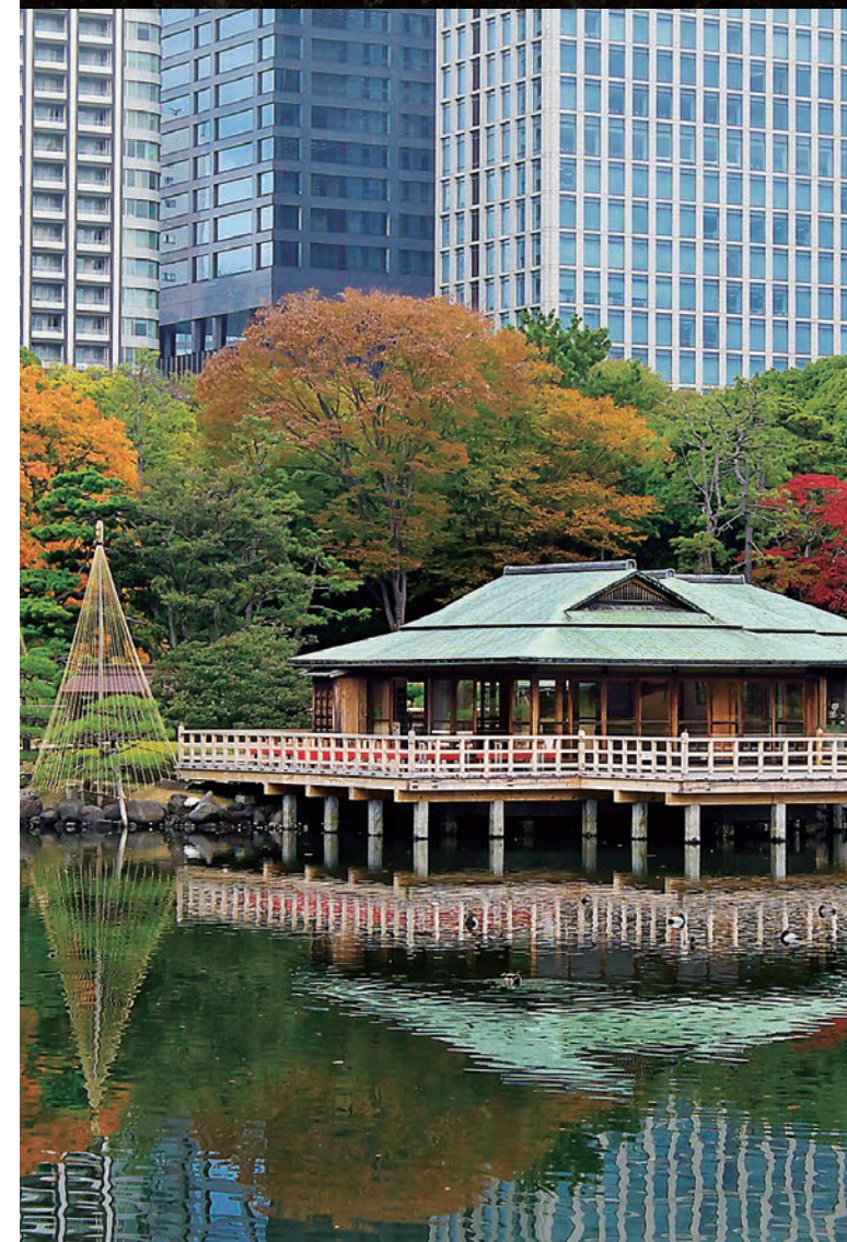
Organe gestionnaire: Association Municipale des Parcs et Jardins de Tokyo (Fondation d'Utilité Publique avec la Personnalité Juridique)