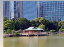
Shioiri-no-ike (estanque de agua marina) y Nakajima-no-ochaya