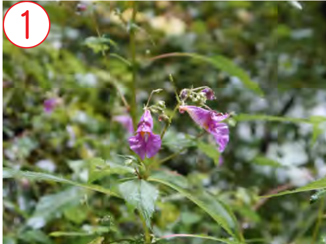
ツリフネソウ(ツリフネソウ科)