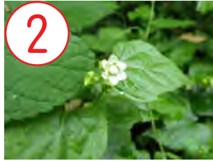
ミヤマフユイチゴ(バラ科)