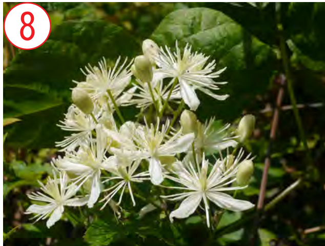
ポタンズル(キンポウゲ科)