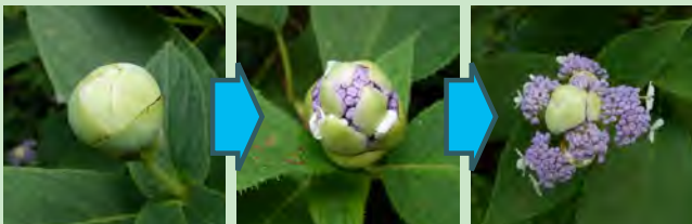
総苞で包まれた蕾は徐々に開きます。

氷川渓谷にはタマアジサイを多く見ることができます。タマアジサイの蕾は花を守る総苞と呼ばれるもので覆われているため、丸い形をしています。この蕾の形が名前の由来であり、タマアジサイを見分ける特徴となっています。