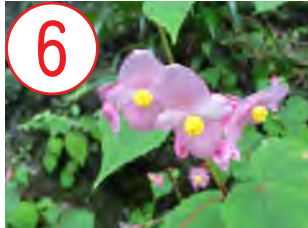
シュウカイドウ(シュウカイドウ科)