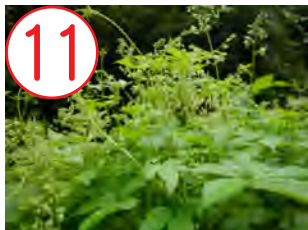
カナムグラ(アサ科)