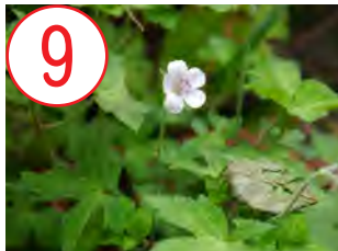
ゲンショウコ(フウロソウ科)