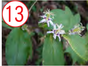
ヤマジノホトギス(ユリ科)