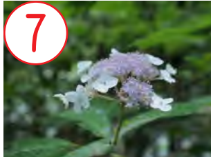
タマアジサイ(アジサイ科)