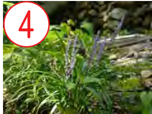
ヤブラン(キジカクシ科)