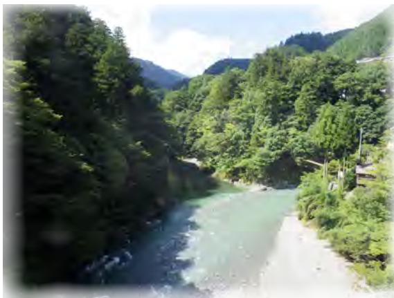
昭和橋から眺める氷川渓谷 撮影日：2016/08/25

氷川渓谷は奥多摩駅から徒歩数分、多摩川と日原川が合流する地点周辺の渓谷で、季節ごとに移りゆく奥多摩の自然を楽しめます。また、遊歩道や吊り橋があるため、手軽に散策することもできます。