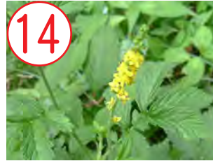
キンミズヒキ(バラ科)