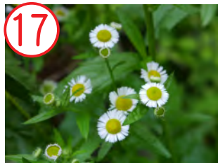
17 ヒメジヨオン(キク科)