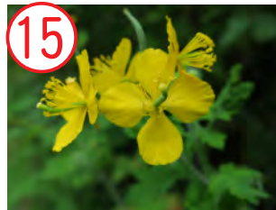
15 クサノオウ(ケシ科)