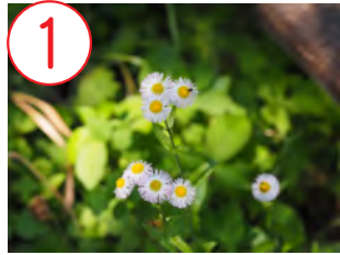
1 ハルジオン(キク科)