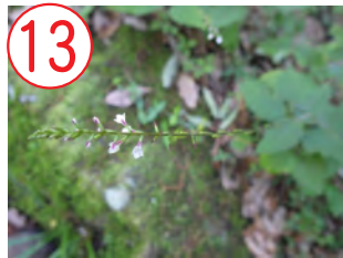
13 ハエドクソウ(ハエドクソウ科)