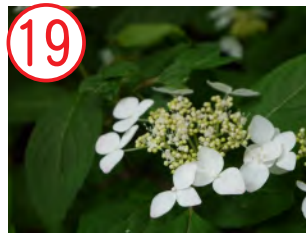
19 ヤマアジサイ(アジサイ科)