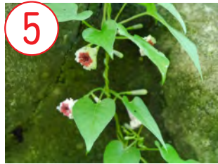
5 ヤイトバナ(アカネ科)