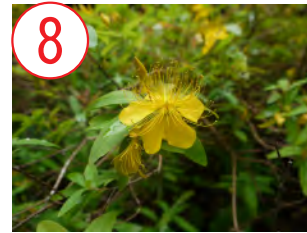
8 ビヨウヤナギ(オトギリソウ科)