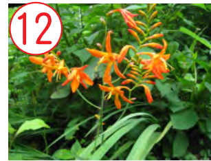
12 ヒメヒオウギズイセン(アヤメ科)