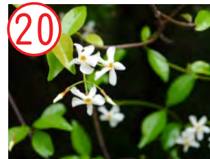
20 テイカズラ(キョウチクトウ科)