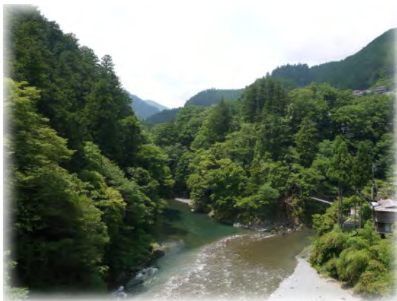
昭和橋から眺める氷川渓谷 撮影日：2014/06/26

氷川渓谷は奥多摩駅から徒歩数分、多摩川と日原川が合流する地点周辺の渓谷で、季節ごとに移りゆく奥多摩の自然を楽しめます。また、遊歩道や吊り橋があるため、手軽に散策することもできます。