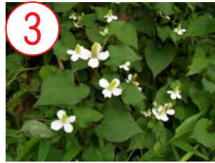
3 ドクダミ(ドクダミ科)