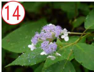
14 タマアジサイ(アジサイ科)