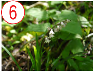
6 オオバジャノヒゲ(キジカクシ科)