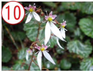
10 ユキノシタ(ユキノシタ科)