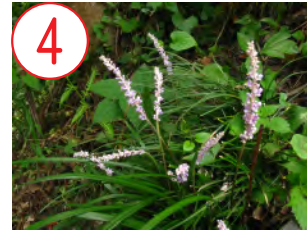
4 ヤブラン(キジカクシ科)