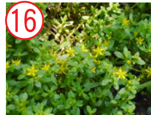
16 コモチマンネングサ(バンケイソウ科)