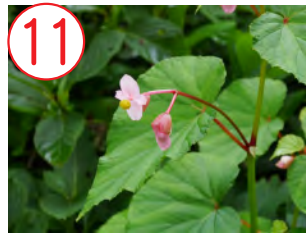
11 シュウカイドウ(シュウカイドウ科)