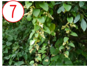
7 アオツツラフジ(ツツラフジ科)