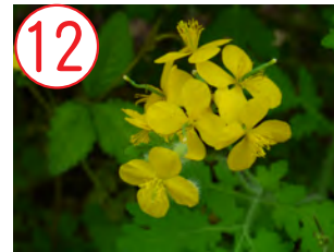
12 クサノオウ(ケシ科)