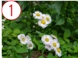
1 ハルジオン(キク科)