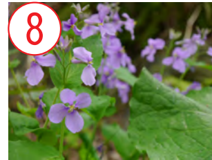
8 ショカツサイ(アブラナ科)