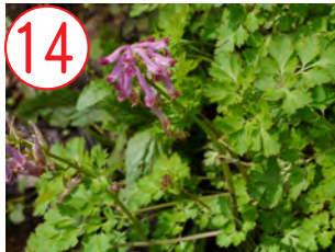
14 ムラサキケマン(ケシ科)