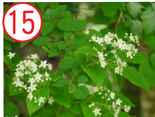
15 マルバウツギ(アジサイ科)