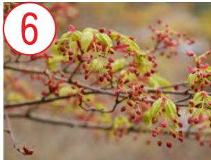
6 イロハモミジ(ムクロジ科)