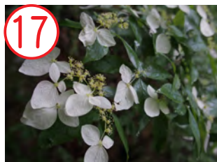
17 ガクウツギ(アジサイ科)