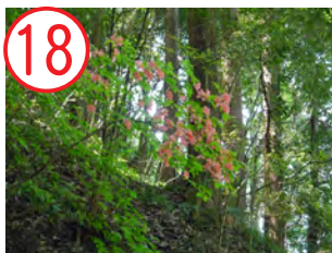
18 ヤマトツツジ(ツツジ科)