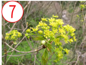
7 オニイタヤ(ムクロジ科)