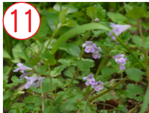
11 カキドオシ(シソ科)