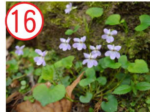
16 タチツボスミレ(スミレ科)