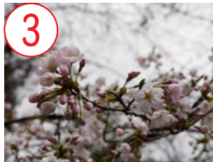
3 ソメイヨシノ(バラ科)