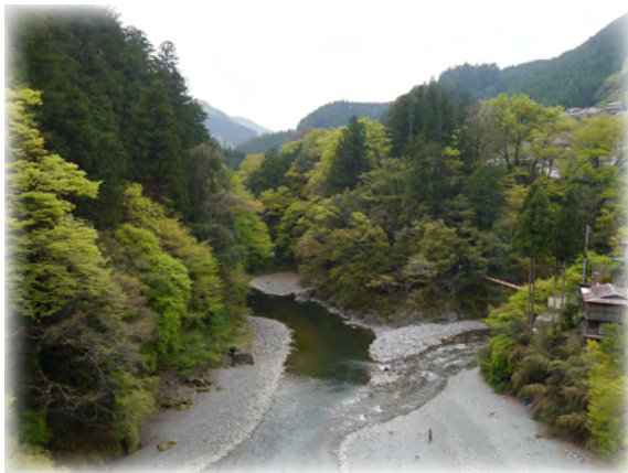
昭和橋から眺める氷川渓谷 撮影日：2016/04/21

氷川渓谷は奥多摩駅から徒歩数分、多摩川と日原川が合流する地点周辺の渓谷で、季節ごとに移りゆく奥多摩の自然を楽しめます。また、遊歩道や吊り橋があるため、手軽に散策することもできます。