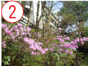
2 ミツバツツジ(ツツジ科)