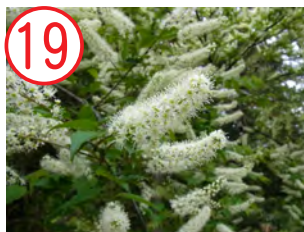
19 ウワミズザクラ(バラ科)