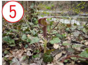
5 ミミガテンナンショウ(サトイモ科)