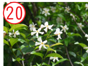
20 テイカズラ(キョウチクトウ科)