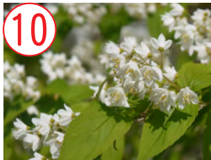
10 ヒメウツギ(アジサイ科)