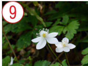
9 ニリンソウ(キンポウゲ科)