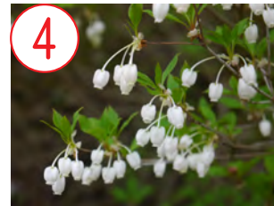
4 ドウダンツツジ(ツツジ科)