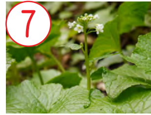
7 ワサビ(アブラナ科)