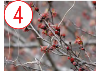
4 フサザクラ(フサザクラ科)