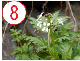
8 コンロンソウ(アブラナ科)