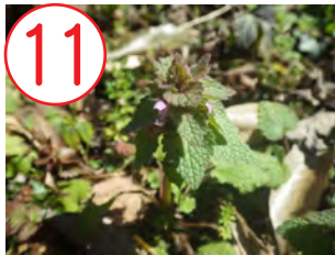
11 ヒメオドリコソウ(シソ科)