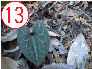
13 カンアオイ(ウマノスズクサ科)