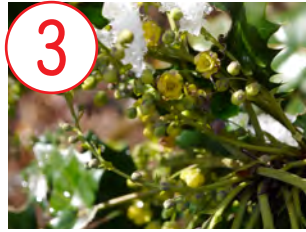
3 ヒイラギナンテン(メギ科)