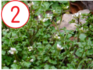
2 ミチタネツケバナ(アブラナ科)