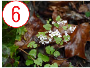
6 ユリワサビ(アブラナ科)