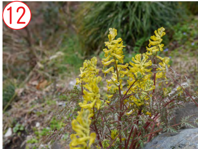
12 ミヤマキケマン(ケシ科)