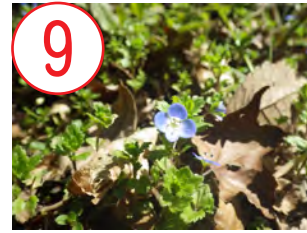
9 オオイヌノフグリ(オオバコ科)