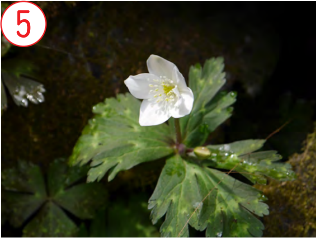
5 ニリンソウ(キンポウゲ科)