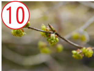
10 アブラチャン(クスノキ科)