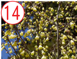
14 ヒユガミズキ(マンサク科)