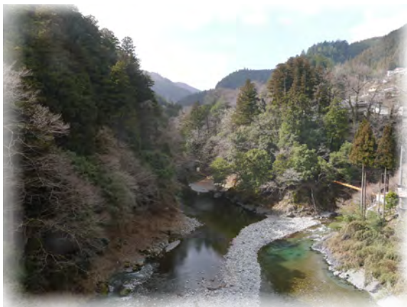
昭和橋から眺める氷川渓谷 撮影日：2015/03/05

氷川渓谷は奥多摩駅から徒歩数分、多摩川と日原川が合流する地点周辺の渓谷で、季節ごとに移りゆく奥多摩の自然を楽しめます。また、遊歩道や吊り橋があるため、手軽に散策することもできます。