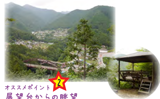
オススメポイント 2 展望台からの眺望(松ノ木尾根) 松ノ木尾根の登山道には、展望台があり、多摩川の流れをパノラマビューで俯瞰できます。