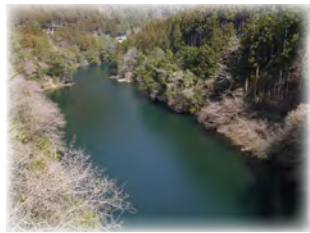
② 数馬峡・白丸湖(数馬峡橋) 発電用に貯められた白丸ダムの水面が綺麗です。