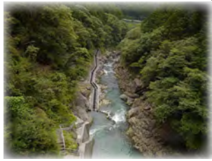
③ 多摩川のながれ(白丸ダム) ダムの堰堤からは魚のために設置された魚道が見えます。ダムの管理棟は一般公開されており、施設内で遡上する魚を見ることができます。 ※一般公開の日程は奥多摩ビジターセンターにお問い合わせください。