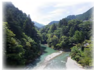
① 氷川渓谷(昭和橋) 多摩川と日原川の合流地点。休日は多くの方で賑わいます。