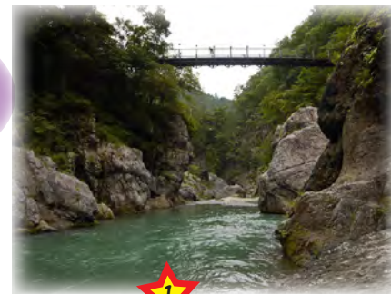
オススメポイント 1 川辺を歩くことができる(鳩ノ巣渓谷) 鳩ノ巣渓谷では、水面に手が届くほど近づける場所もあり、水面から見上げた渓谷の眺めをたのしむことができます。 ※増水時は遊歩道が水没することがあります。ご注意ください。