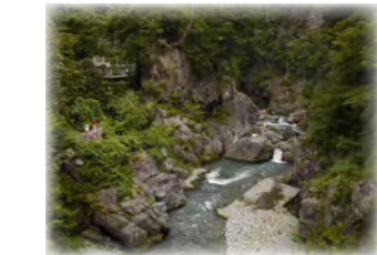
④ 鳩ノ巣渓谷(鳩ノ巣小橋) コースの中でも、特に美しい渓谷の風景を楽しむことができます。

*コース中には、登山道や滑りやすい岩場もあります。ハイキングシューズの着用をおすすめします。