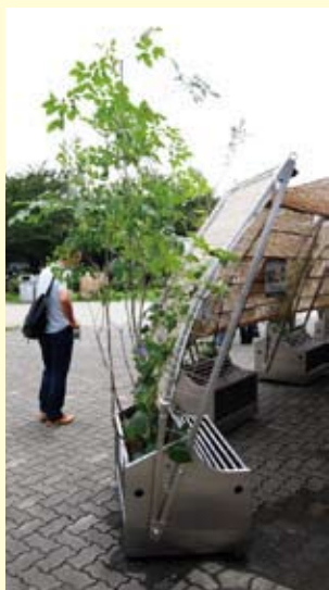
みどりの元気山車イメージ

このイベントは(公財)東京都公園協会「まちなか緑化活動支援事業」の協力を得ています。主催:久我山連合商店会