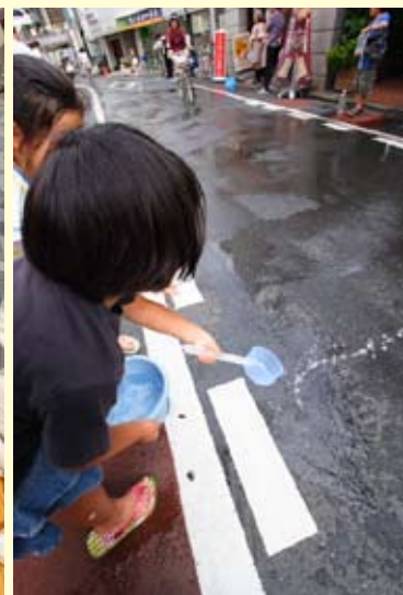
まちを涼しくする打ち水