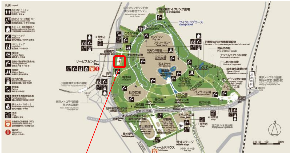
スタンプ設置箇所：代々木公園サービスセンター