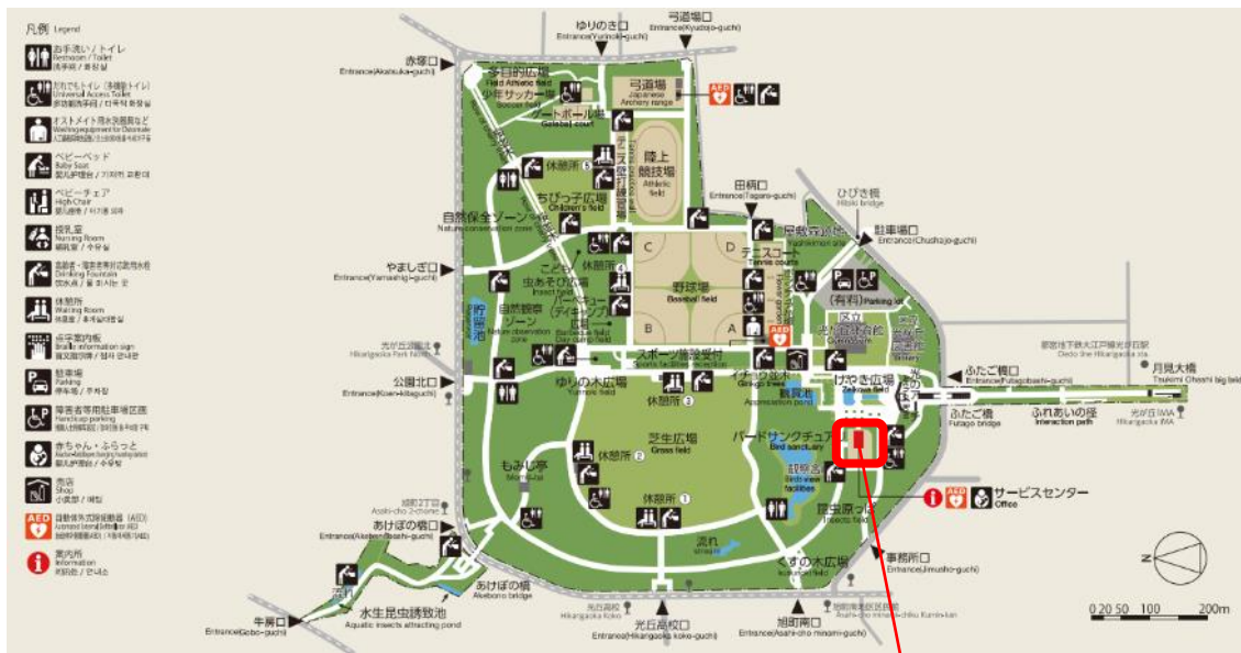
スタンプ設置箇所：光が丘公園サービスセンター