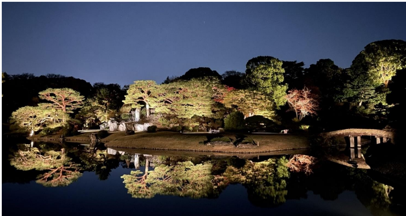
「庭紅葉の六義園」ライトアップ (過去の様子)

都内有数の紅葉の名所である六義園。園内が鮮やかに色づくこの時季に、普段はご入園いただけない夜間に特別開園し、紅葉で彩られた庭園のライトアップや土蔵壁面へのプロジェクション投影を行います。