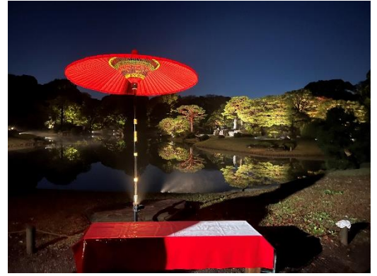
フォトスポット(過去の様子)