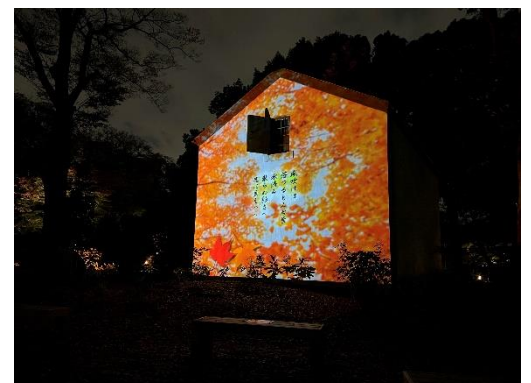
土蔵ジェクション(過去の様子)

内容：三菱の創業者・岩崎家所有の時代に建てられた土蔵の壁面に、「和歌の庭」であることをイメージしたプロジェクション映像が流れます。