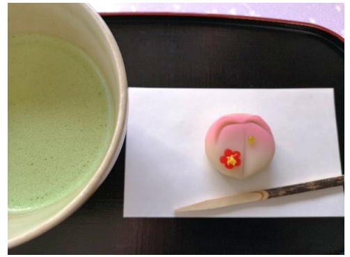
抹茶と和菓子 (イメージ)

日 時：期間中毎日 18時30分～21時 (L.O. 20時30分) 場 所：吹上茶屋、心泉亭 内 容：散策中の休憩にぴったりなお抹茶と和菓子のセット、 六義園オリジナルお土産等を販売します。