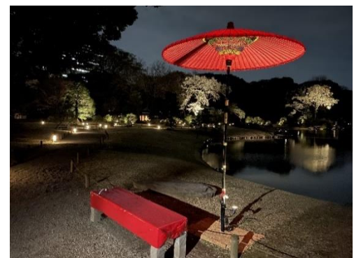
フォトスポット(イメージ)

日 時：期間中毎日 18時30分～21時 場 所：園内各所（状況により、場所の変動あり） 内 容：園内複数箇所にフォトジェニックな 撮影スポットが登場。風情ある設えを背景に、 記念撮影をお楽しみください。