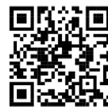
X (旧 Twitter)

■六義園公式 X (旧 Twitter) : https://x.com/RikugienGarden