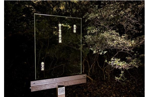
ことばのあかり（イメージ）

日 時：期間中毎日 18時30分～21時 場 所：園路周辺 内 容：アクリル導光板に六義園八十八境の由来となった 和歌を映し出し、まるで空中に光で書かれた和歌が 浮かび上がるかのような演出をします。