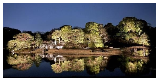
過去のライトアップの様子

内容：しだれ桜を中心に、六義園の主景観のひとつである中の島、吹上松 ふきあげのまつ 、滝見茶屋、吟花亭跡 ぎんかていあと 、水香江 すいこうのえ など各スポットをライトアップします。