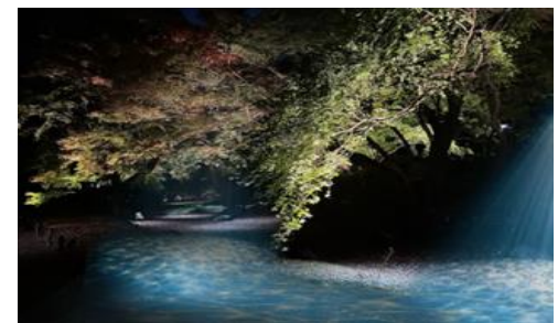
水香江プロジェクション(イメージ)

日 時：期間中毎日 18時30分～21時 場 所：水香江 内 容：かつて水が流れていたとされる水香江。 光によって水の流れを再現し、 光の蓮を浮かび上がらせます。