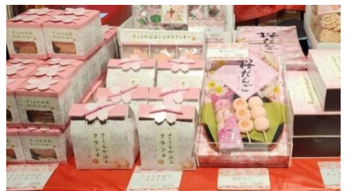
六義園オリジナルお土産 (イメージ)

日 時：期間中毎日 18時30分～21時 場 所：しだれ桜付近 内 容：六義園オリジナルお土産等を販売します。