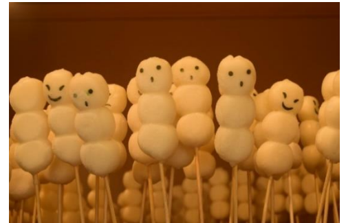
東京やきもち (イメージ)

日 時：期間中毎日 18時30分～20時30分 場 所：しだれ桜付近 内 容：可愛い顔がついたお団子「東京やきもち」を 販売します。