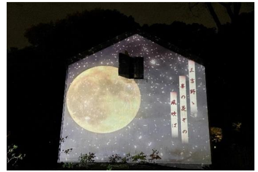
土蔵ジェクション（イメージ）

日 時：期間中毎日 18時30分～21時 場 所：土蔵（外壁） 内 容：三菱の創業者・岩崎家所有の時代に建てられた 土蔵の壁面に、和歌をイメージした プロジェクション映像が流れます。