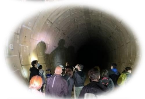
令和4年度 見学会実施の様子