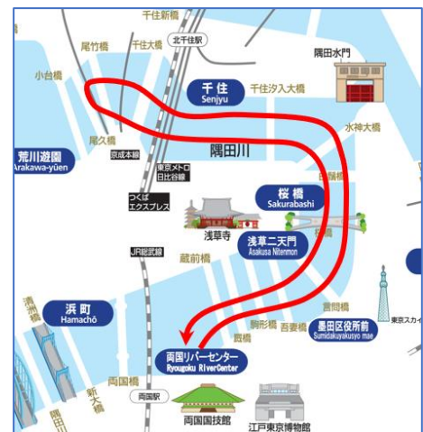
【コース図イメージ】