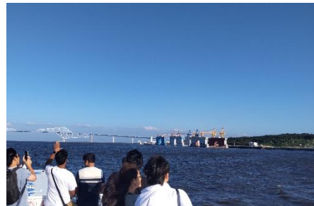
【海の森公園付近の風景】