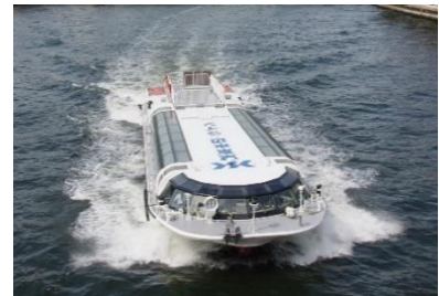
【水上バスイメージ】

「水上バスから観察する 東京港の冬の野鳥」 葛西臨海公園から建設局所有の水上バスに乗船し、海の森公園周辺やお台場、豊洲などを巡ります。冬の東京に飛来する野鳥を船上から観察することを通じて、臨海部の環境について学びます。