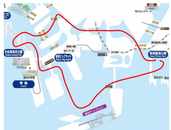
【コース図イメージ】

別図の通り 葛西臨海公園～東京港を航行（海の森公園、お台場、豊洲、夢の島方面）～葛西臨海公園