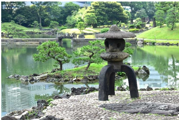
旧芝離宮恩賜庭園