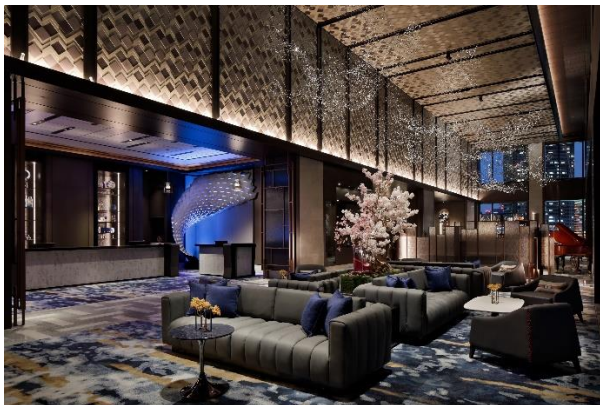
メズム東京オートグラフィコレクション ロビー

水上バスで行くラグジュアリーツアー メズム東京のスイーツティータイムと 夕暮れの庭園散策