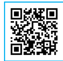
東京水辺ライン公式HP

【締切日】令和6年12月15日（日）17時まで ※応募多数の場合は抽選となります。 ※抽選結果はメールにてお知らせします。 ※詳しくは東京水辺ライン公式HPをご覧ください。