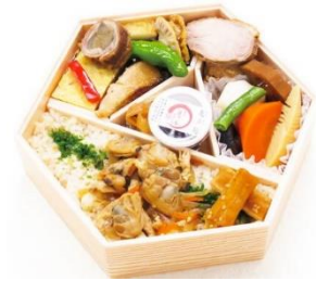
ミニすみだ川季節弁当（イメージ）