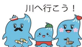
かわいこちゃんパパ かわいこちゃん かわいこちゃんママ 東京の河川PRキャラクター