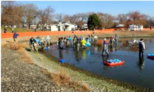
生物の捕獲・保護作業の様子（武蔵野の森公園）

※1 農作業が終わる冬にため池から水を抜き、一定期間干して、清掃、堤や水路の点検補修を行う作業を「かいぼり」と言います。近年は、公園などの池で水質改善や外来種駆除を目的に行われる事例が増えています。