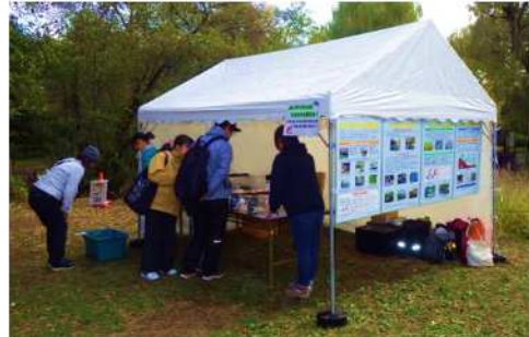
捕獲された生物の生体展示の様子（石神井公園）