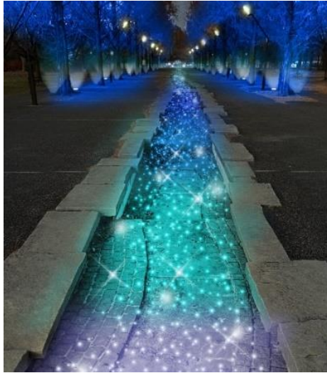
▲メタセコイア・流れ (演出イメージ)