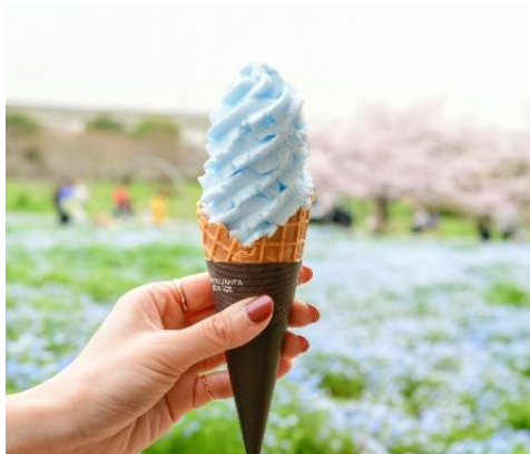
▲ネモフィラソフト（イメージ）

期間中には、キッチンカーが出店し、近くにはライトアップされた休憩スペースも登場します。また、園内の売店には、期間限定の「ネモフィラソフト」も登場します！トネリブルーとあわせて、園内でドリンクやフードをお楽しみください。