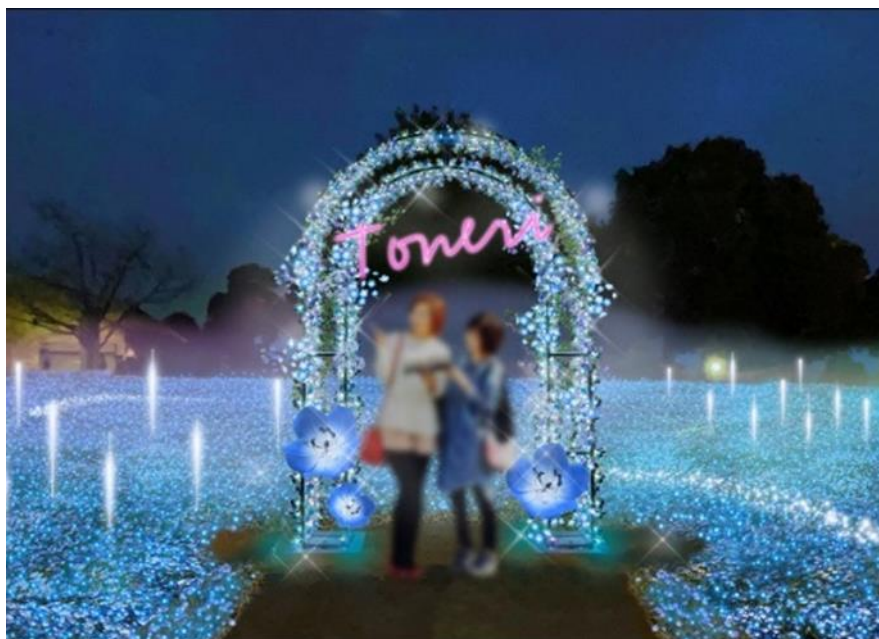
▲フォトスポット (演出イメージ)

満開のネモフィラ花壇の撮影に最適な場所には、フォトスポットを設置。トネリブルーをバックに、記念撮影をお楽しみいただけます。