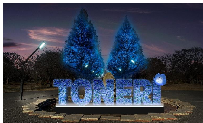
▲噴水周辺 (演出イメージ)