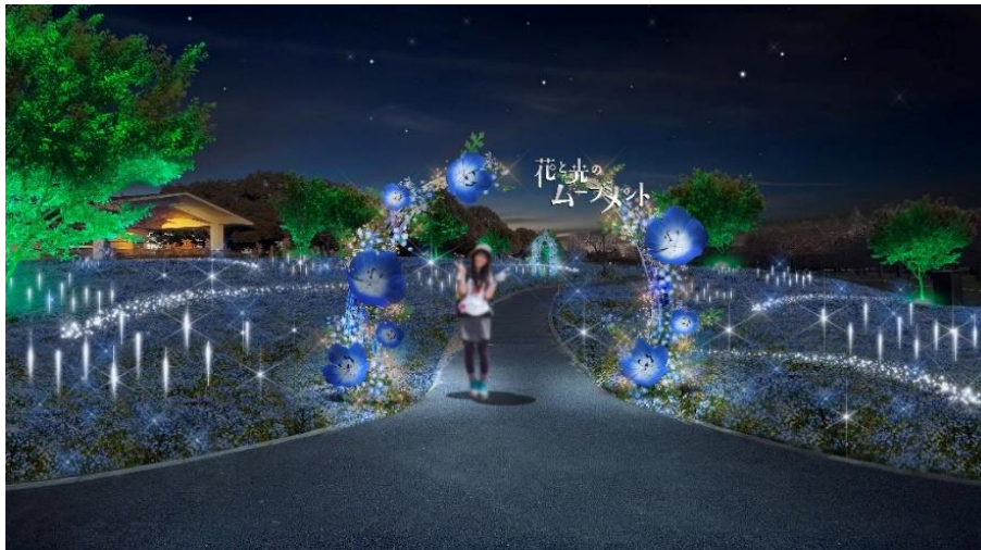
▲芝生広場 (演出イメージ)

本イベントの主演となるネモフィラ花壇では、一つひとつの小さな花が凜と美しく見えるようこだわり抜いたトネリブルーのライトで、ネモフィラの海を美しく照らします。あわせて、夜間は音による演出も実施。音に合わせて光るイルミネーションは、まるで夜空の星のよう。一面に広がるネモフィラと、舎人の空が溶け合い、幻想的な風景を生みだします。思わず息をのむような、ネモフィラの魅力があふれる世界観で、皆様をお出迎えします。