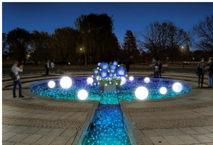
▲噴水周辺・流れ (演出イメージ)