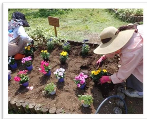
ボランティアの皆さんによる 花壇管理の様子