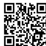
「ふれあいどうぶつえん」 申込ページ