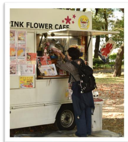
キッチンカー出店の様子 (過去イベント)

※プログラムの内容や開催場所は、変更になる場合があります。 変更の場合は、青山公園公式 X (旧 Twitter) にて当日 8 時以降にお知らせします。