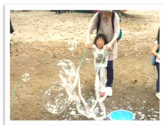
シャボン玉いっぱい（昨年の様子）