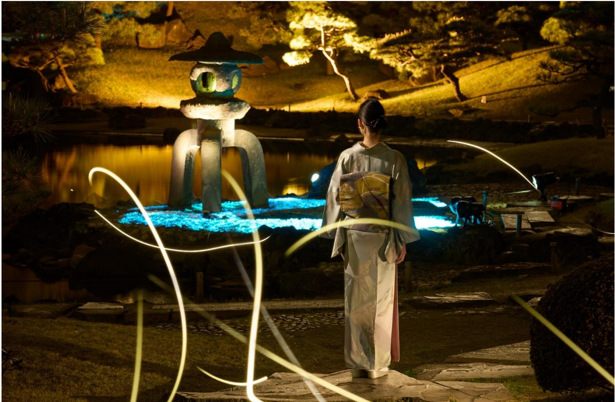
雪見灯籠のライトアップ（イメージ）

旧芝離宮恩賜庭園では、ライトアップイベント「旧芝離宮夜会 ～ひかりめぐる庭～」を開催いたします。