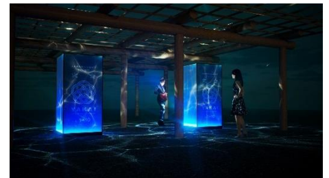
棚間の記憶（イメージ）