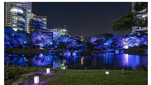
ライトアップショー（イメージ）