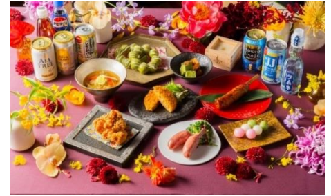
夜会ダイニング～Yakai Dining～（イメージ）

内容：歴史ある庭園の空気に包まれながら、夜会限定の特別なお料理をお楽しみいただけます。今年は藤棚のほりと馬場跡の2ヶ所で実施いたします。ここでしか味わえないひと皿とともに、特別な夜をご堪能ください。