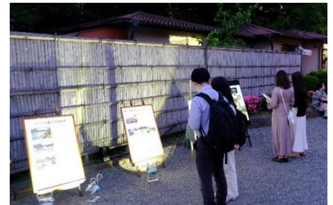
パネル展示（昨年の様子）

内容：旧芝離宮恩賜庭園の歴史や見どころを絵図や古写真でまとめたパネル展示、ひと休みできるスポットをご用意しております。