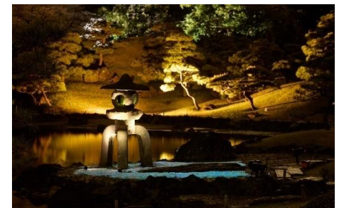
石灯の記憶（イメージ）