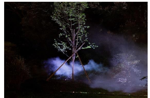
光の陣幕（イメージ）