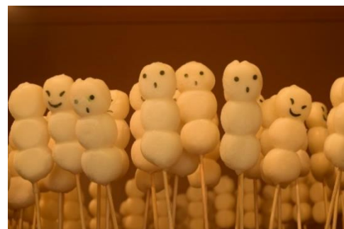
東京やきもち (イメージ)