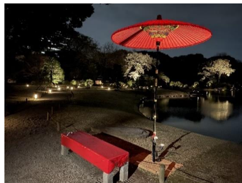
フォトスポット(イメージ)