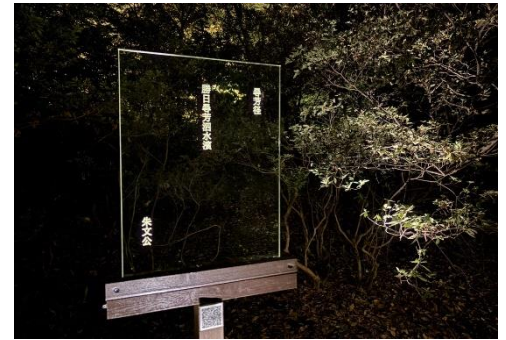
ことばのあかり（イメージ）