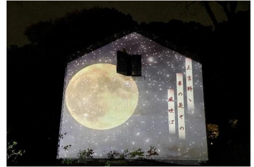
土蔵ジェクション（イメージ）