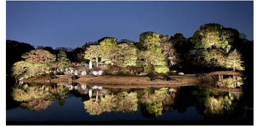
過去のライトアップの様子