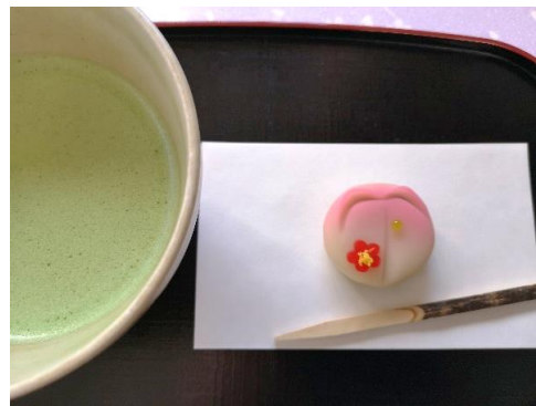
抹茶と和菓子 (イメージ)