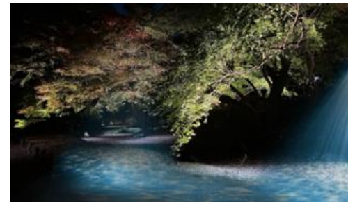
水香江プロジェクション(イメージ)