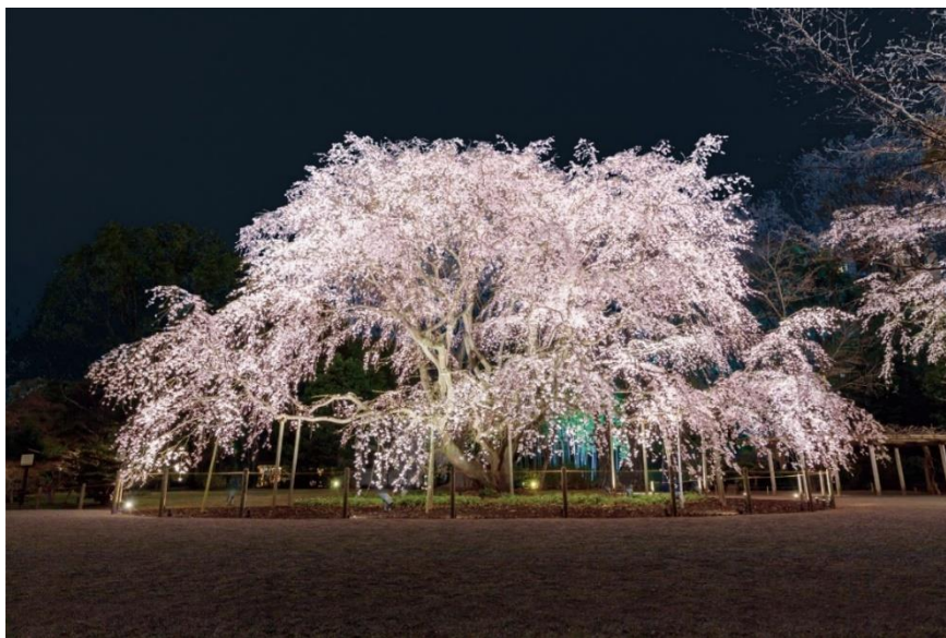
しだれ桜のライトアップ (イメージ)

六義園にて明日3月22日(土)より開催する、春の夜の大名庭園を楽しんでいただく桜花期ライトアップイベント「春夜の六義園 夜間特別観賞」について、当初の見込みより園内のしだれ桜の開花が遅れ本日開花したため、開催期間の延長を決定しました。