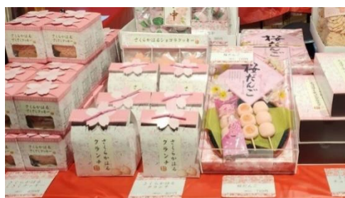
六義園オリジナルお土産 (イメージ)