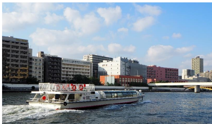
隅田川を上流へと進む水上バス(蔵前橋を望む)

※イベントクルーズの内容、申込方法、参加費、集合場所等の詳細については、次ページをご覧ください。