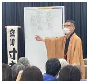
過去のイベントの様子 (令和4年2月28日撮影)