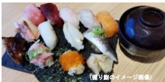
(握り鮓のイメージ画像)

大学卒業後、出版社勤務の間に、師匠となる立川談四楼と出会い、平成23年8月、44歳ながら立川談四楼に入門。平成27年3月、二ツ目昇進。母校の東京都立大学オープンユニバーシティにおいて講師(高座を含む)を務め、人気の講座となる。