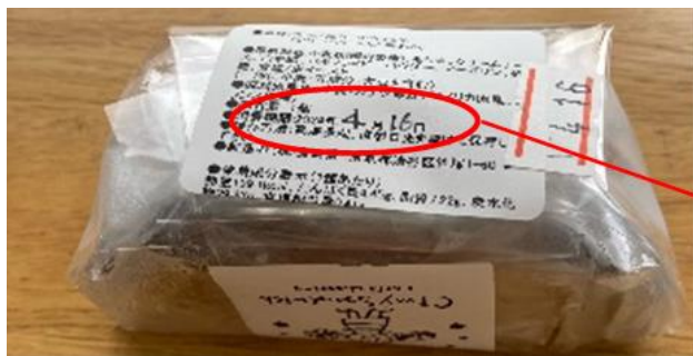
消費期限の年月日を記載