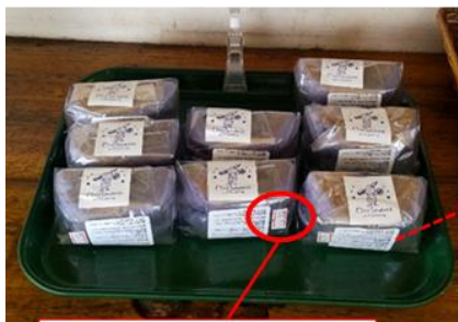
消費期限のシールは添付