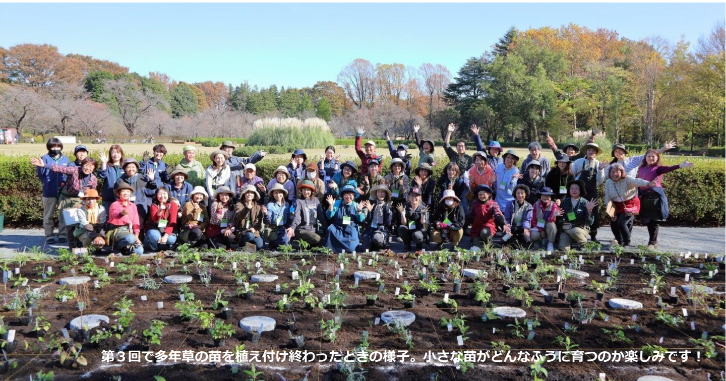
第3回で多年草の苗を植え付け終わったときの様子。小さな苗がどんなふう to 育つのか楽しみです！

JINDAIペレニアルガーデンプロジェクトは、市民の力で宿根草園をリニューアルしていくプロジェクト。9月から始まったワークショップはこんなふうに進んできました。