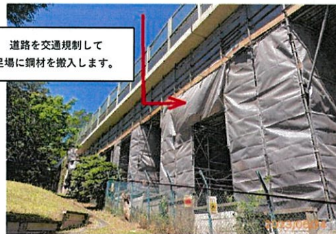
道路を交通規制して 足場に鋼材を搬入します。