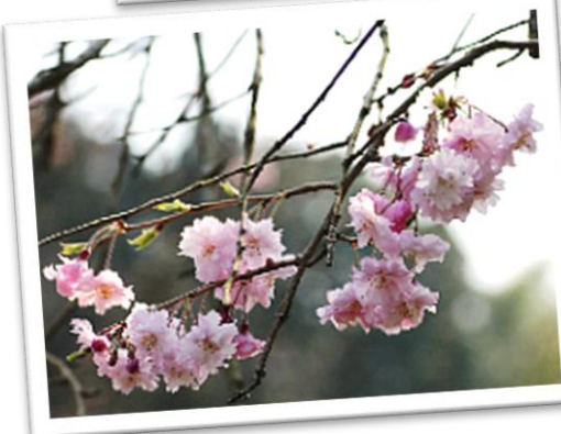
梅木窪分園トイレ脇 ヤエベニシダレ 4月中旬