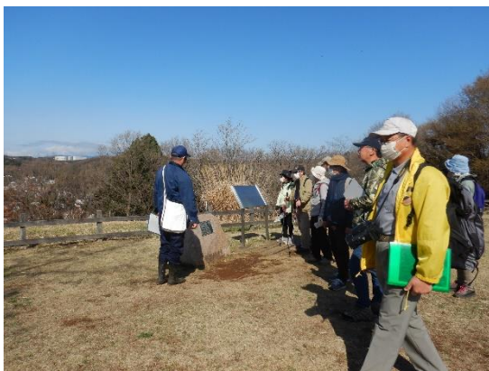
本園みはらし広場

丘陵地レンジャーや「NPO法人まちだ結の里」の講師の方から動植物等のお話を聞きながら、本園サービスセンターから小野路宿里山交流館まで、途中休憩しながら3時間半ほど歩きました。