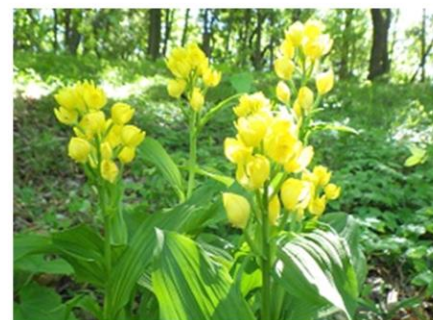
全園 キンラン 4月下旬