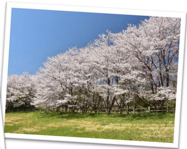
大久保分園 トンボ池上 ソメイヨシノ 4月上旬