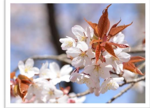
全園 ヤマザクラ4月上旬