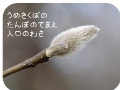
うめきくぼたんぼのてまえ入口のわき