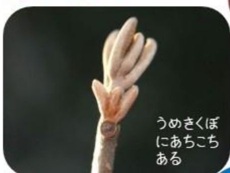
うめきくぼにあちこちある