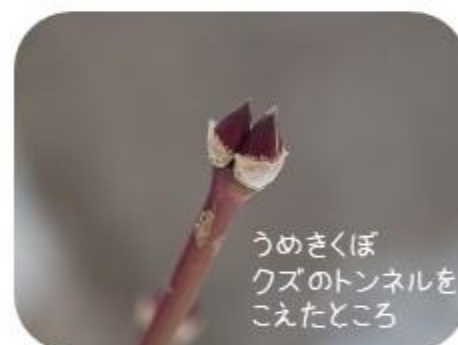
うめきくぼクズのトンネルをこえたところ