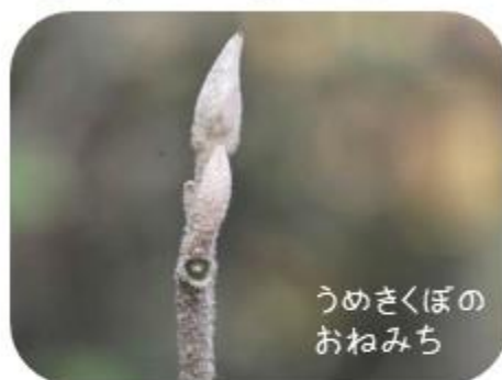
うめきくぼのおねみち