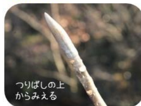
つりばしの上からみえる