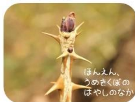
ほんえん、うめきくぼのばやしのなか