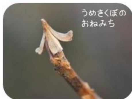
うめきくぼのおねみち