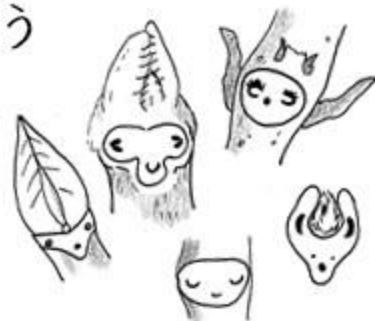
アジサイ、オニグルミ、サワグルミ、クズ、スルデ

冬芽や葉痕には、よくみるとかわいいものがたくさんあります。いろんな木を観察して、自分だけのお気に入りを見つけましょう。