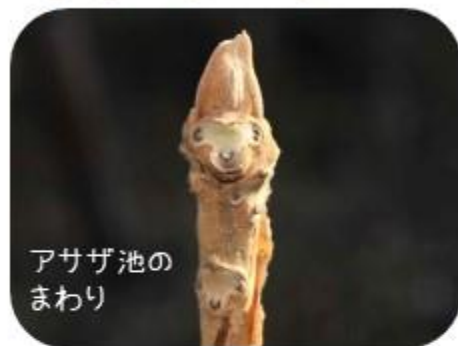
アサザ池のまわり