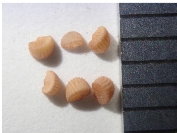
果実の中には1mm程度の種子が6つ入っている