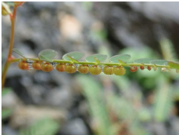
果実は枝に並んでつく

園内の各エリアや園路沿いに果実をつけているコミカンソウが見られます。路傍や畑によく見られるコミカンソウ科の1年草で、見かけたことがある方も多いのではないのでしょうか。主茎から分枝した枝にたくさんの果実をつけます。果実は小さく、まさにミカンのミニチュア版ですが、ミカンと違って中身に果肉はなく、種子がぎっしり入っています。肉眼では確認しづらいのですが、中の種子はミカン割った時の房の様な形で、しわがよっています（写真右下）。