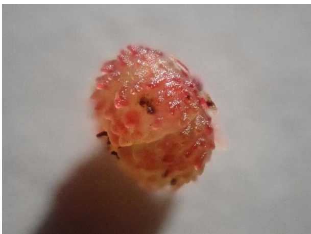
果実の表面：赤色のつぶつぶとした隆起がある