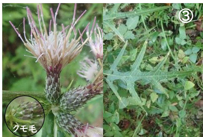
アズマヤマアザミ: 総苞は細く、 クモ毛がある。葉はやや固い。