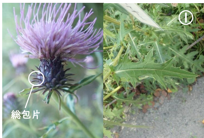
タイアザミ: 総苞片は反り返る。 葉はやや固く、深緑色。

学習園ではいろいろなアザミを見ることができます。アザミの類はパッとみると、皆同じように見えますが、花の形状、葉の形や色艶などをよ〜く見てみると違いがよくわかり、面白いです。開花期の根生葉の有無や総苞の粘りの有無等も違いを見分けるポイントになります。ただ、開花期が同時期であると交雑しやすいこともあり、4枚目の写真のように、2種の特徴をもったものも見られます。この学習園では現物の見比べがすぐできるのでおすすめです。