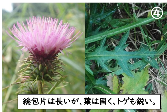
タイアザミとハチジョウアザミの 交雑種と思われる。